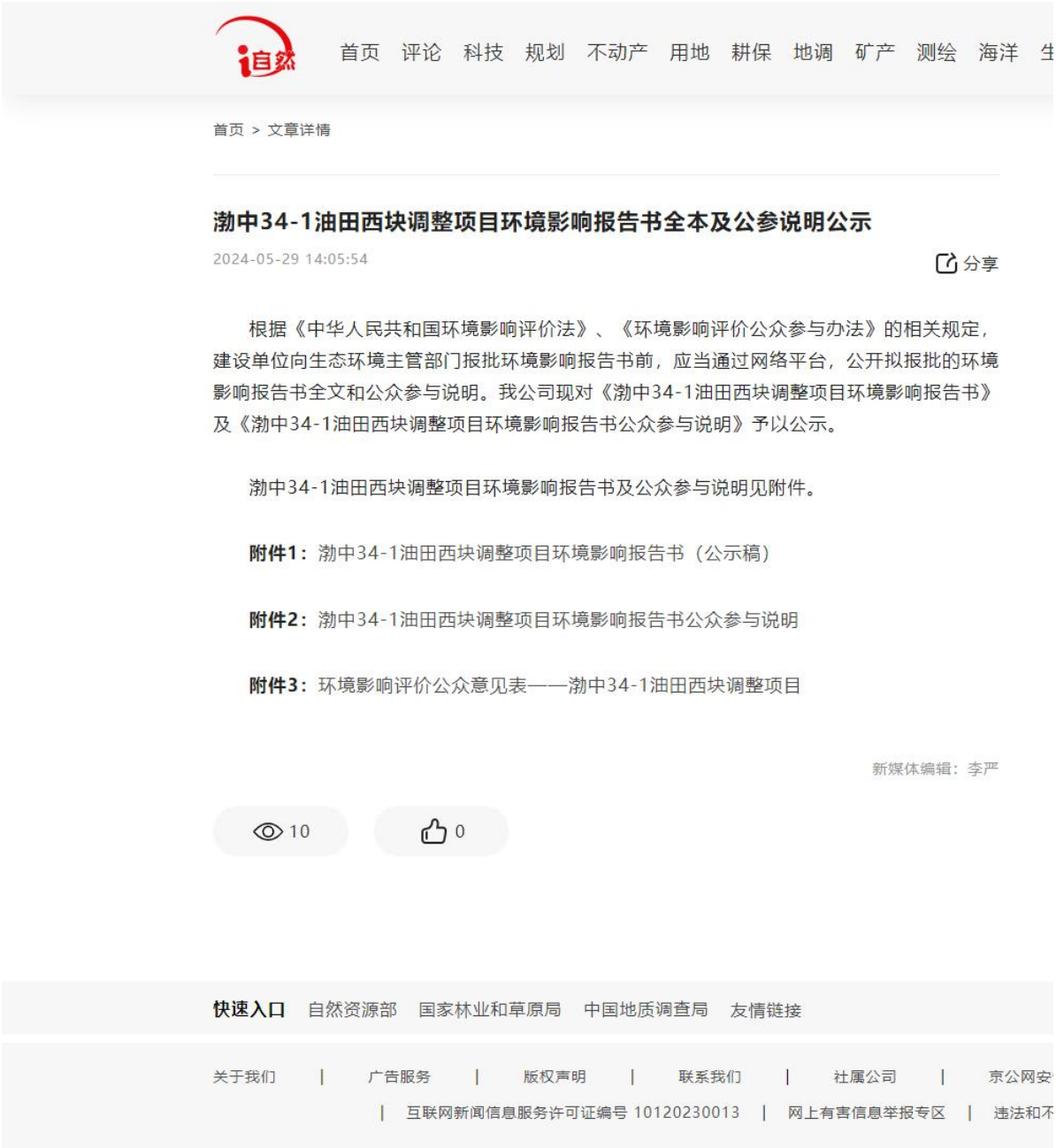
图 6.2-1 报批前网站公示截图