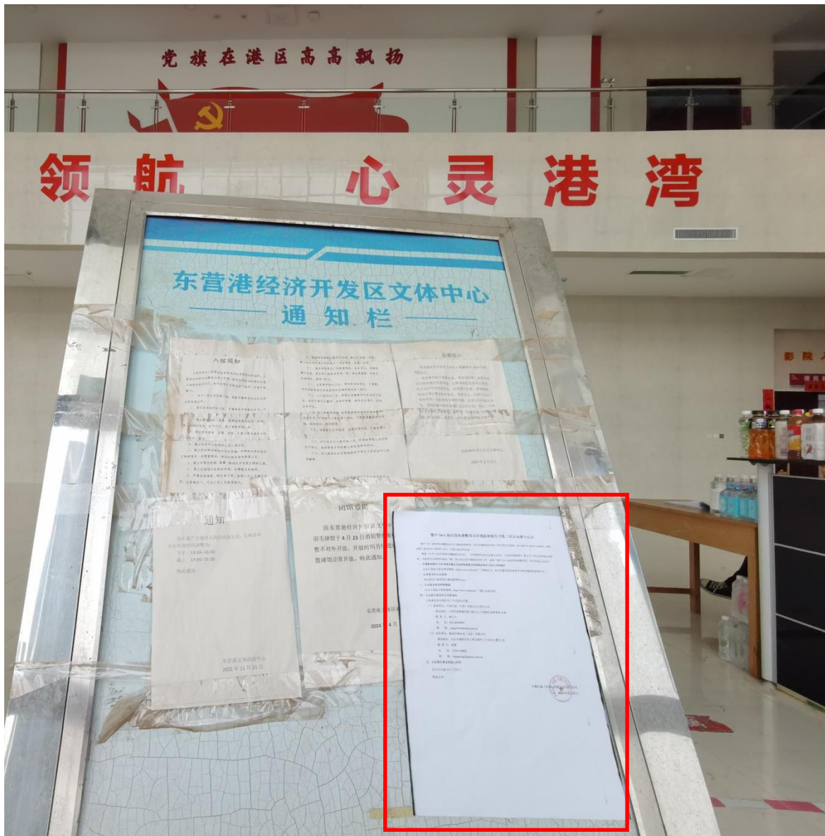
图 3.2-3 第二次公示现场张贴公告照片-2024 年 5 月 15 日