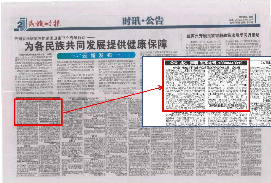
图7 2025年5月20日