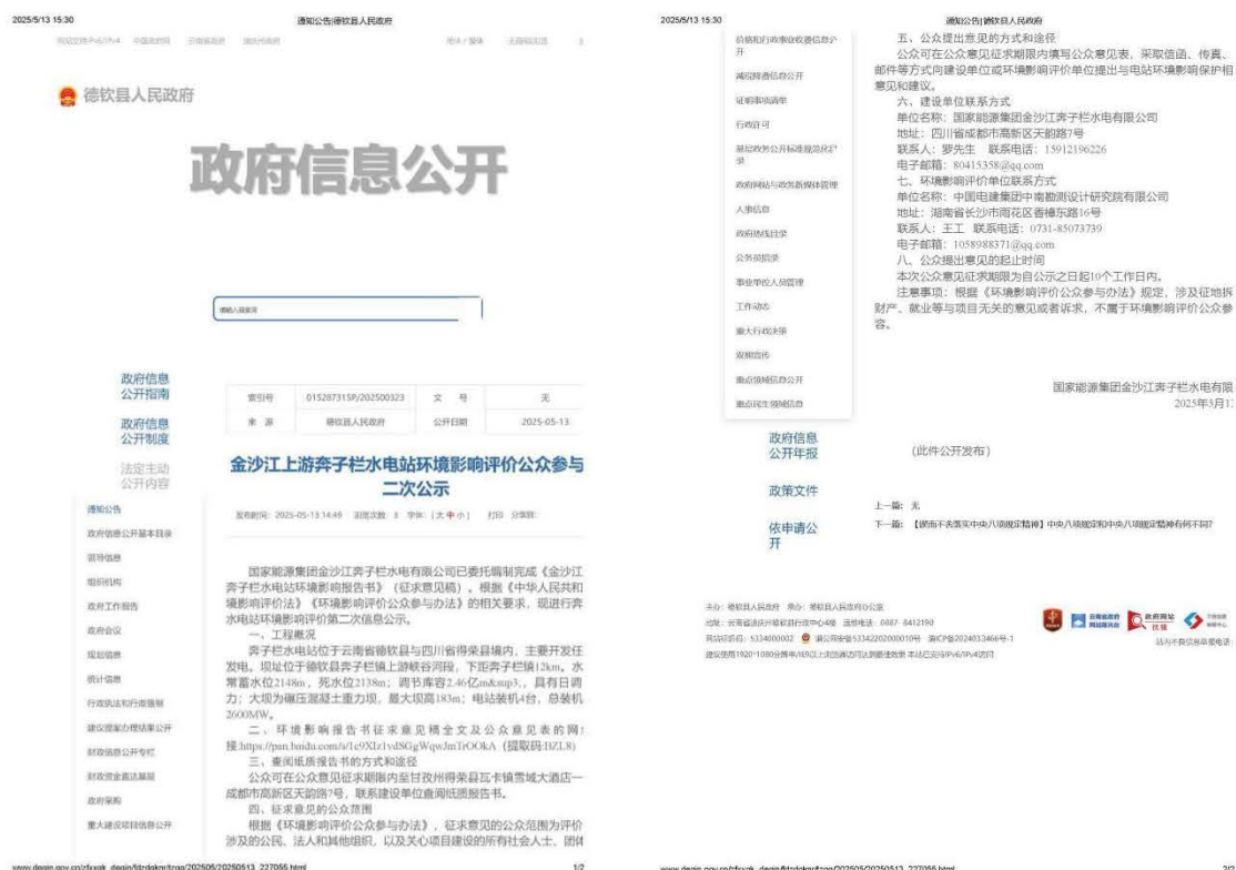
图3 征求意见稿信息德钦县人民政府网站截图

http://www.deqin.gov.cn/zfxxgk_deqin/fdzdgknr/tzgg/202505/20250513_227055.html