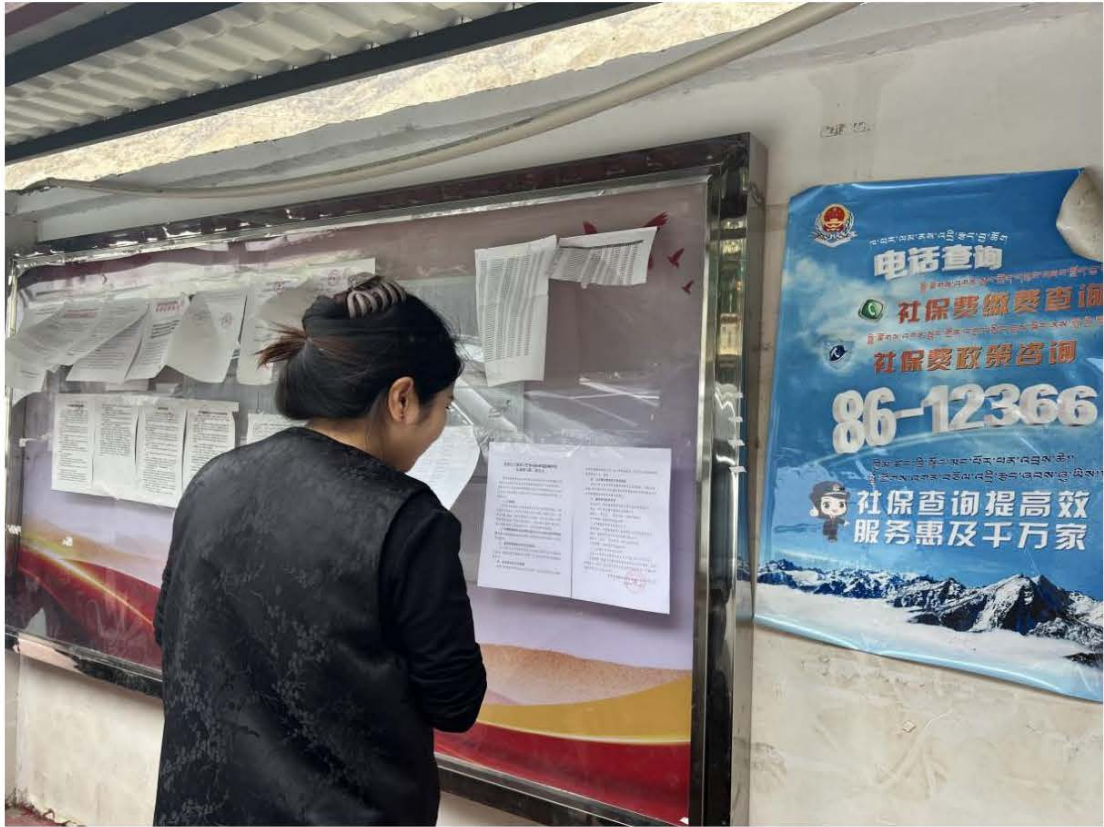
图 10 古学乡公示栏张贴公示