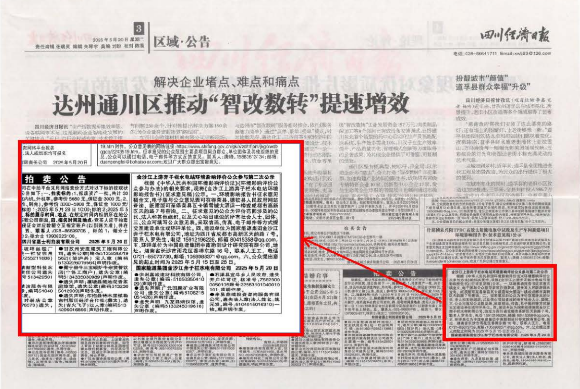
图5 2025年5月20日