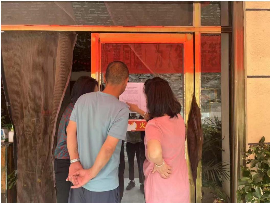
图 14 羊拉乡张贴公示

本次张贴公告选取项目涉及的奔子栏镇、瓦卡镇、徐龙乡、羊拉乡等公示栏，均为公众易于知悉的场所，持续公开期限不少于 10 个工作日。张贴区域的选取及公示时间均满足《环境影响评价公众参与办法》的要求。