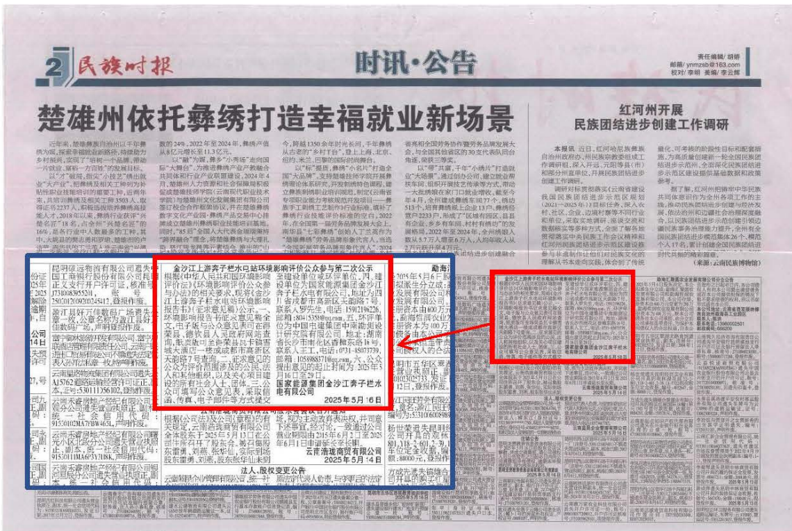
图6 2025年5月16日《云南民族时报》公开照片