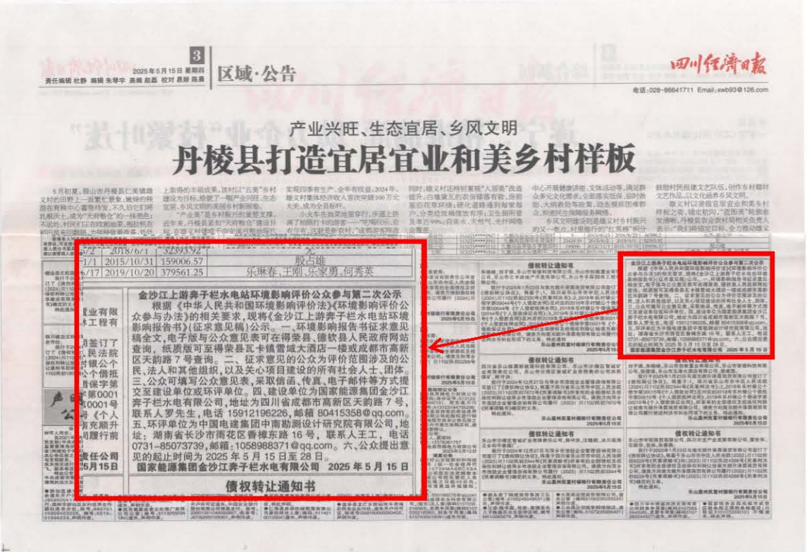
图4 2025年5月15日《四川经济日报》公开照片