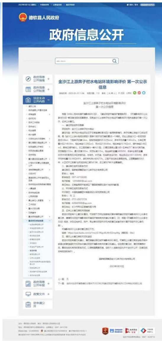
图 1 得荣县（左）、德钦县（右）人民政府网站首次公参截图