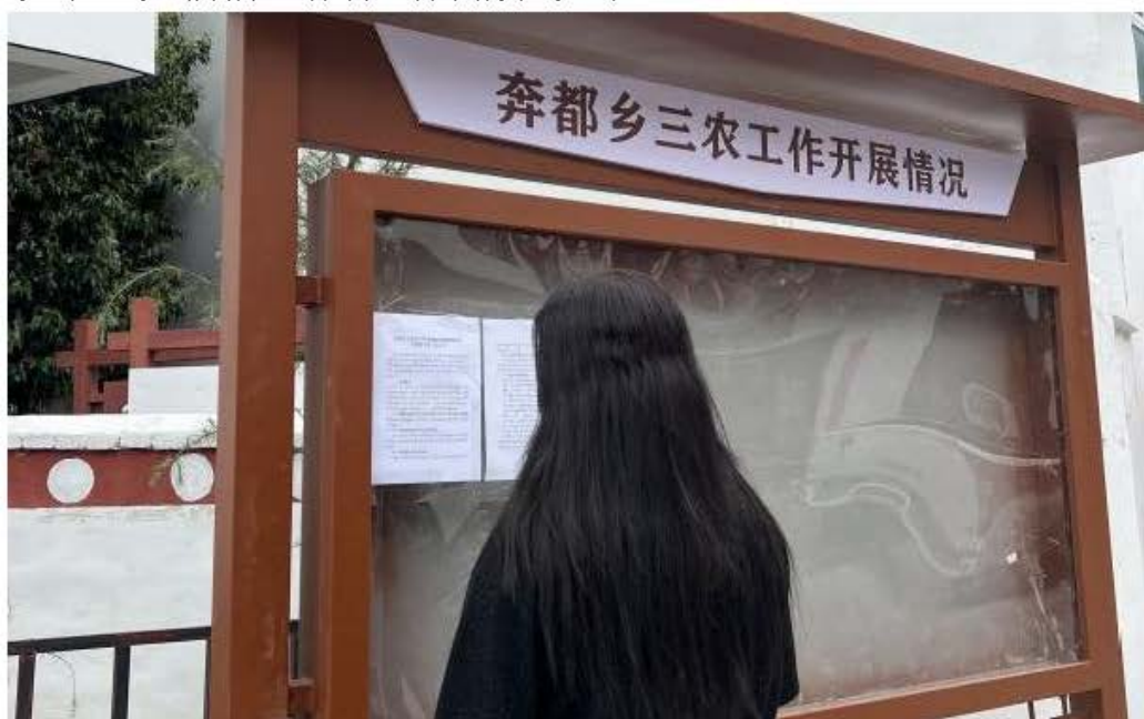
图 8 奔都乡公示栏张贴公示