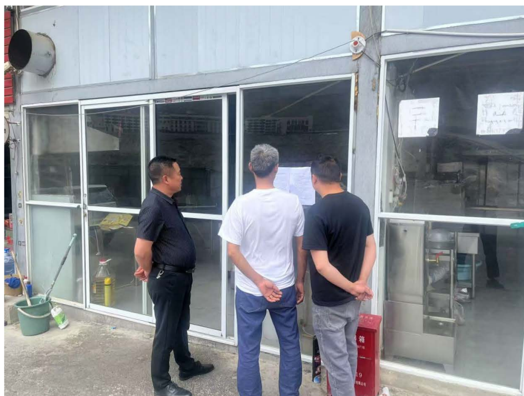
图 13 徐龙乡张贴公示