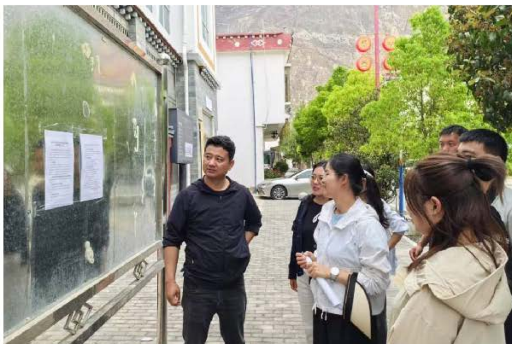
图 9 奔子栏镇公示栏张贴公示