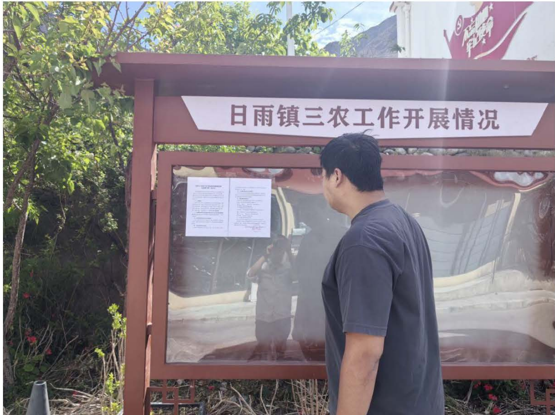
图 11 日雨镇公示栏张贴公示