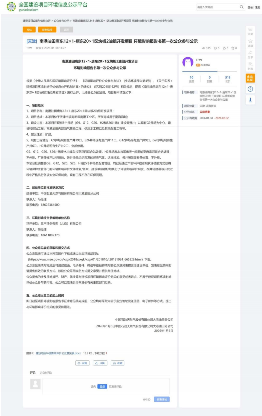
图 2.1-1 第一次网络公开情况