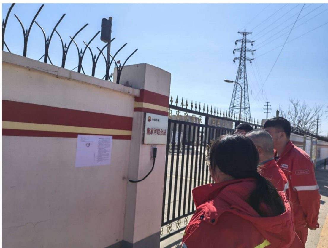
图 3.2-4 现场张贴公示情况