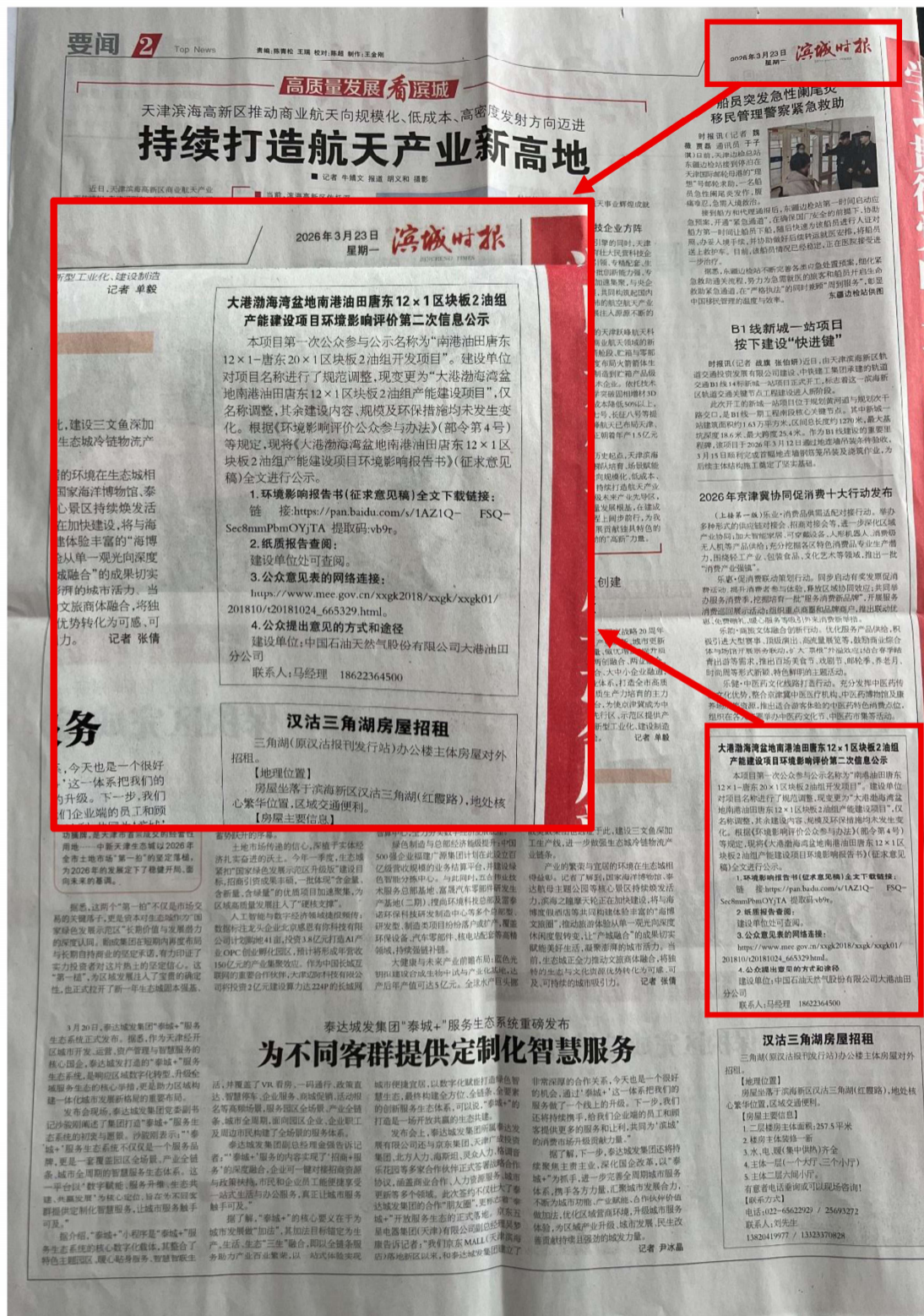
图 3.2.2 报纸第一次公开情况