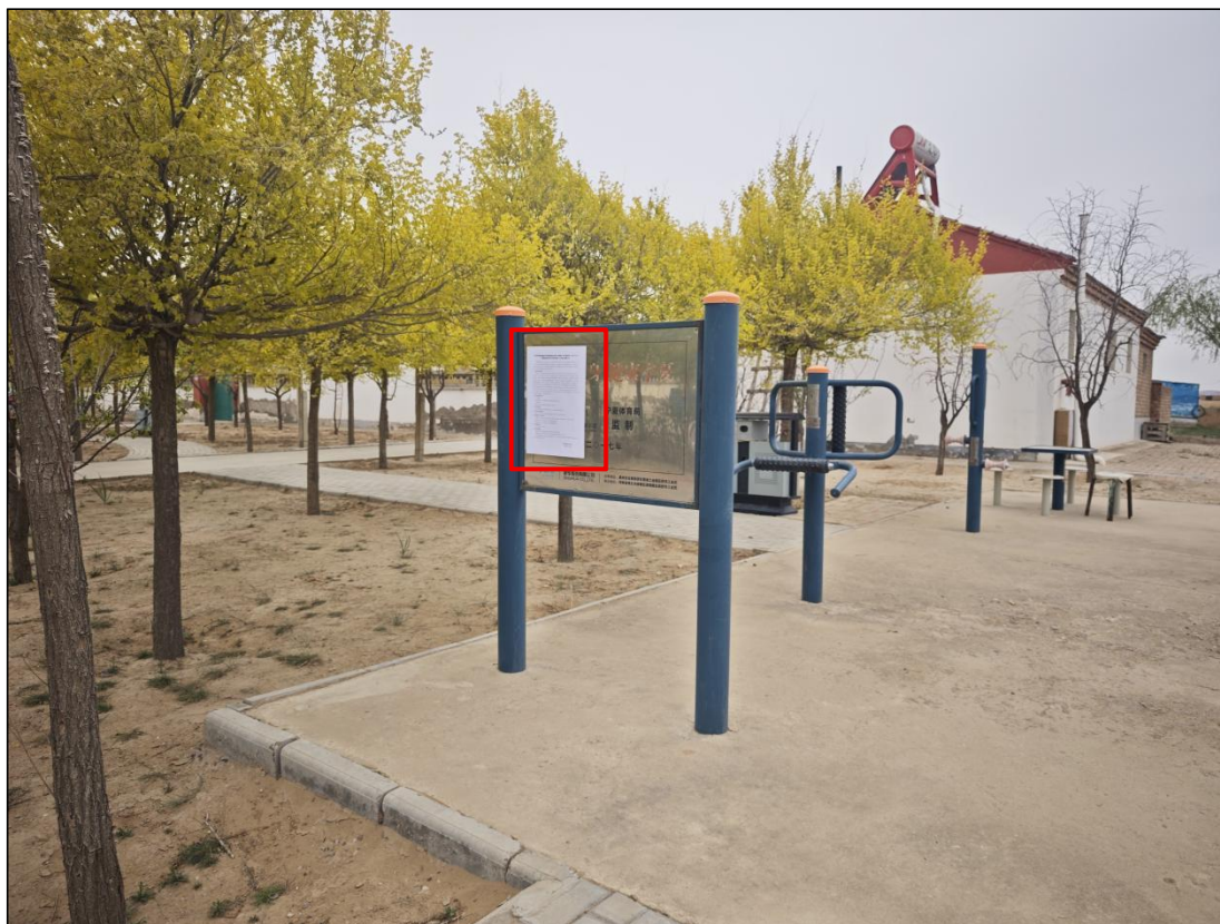
图 17 公众参与信息现场张贴公告图 (野麦子塘村村民健身区)