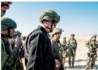
8月21日,以色列国防部长加兰特(前)在加沙地带与埃及接壤地区的“费城走廊”视察。

何为“甌城走廊”？为何这一“走廊”的控制权威为影响谈判的症结？谈判会受到多大影响？