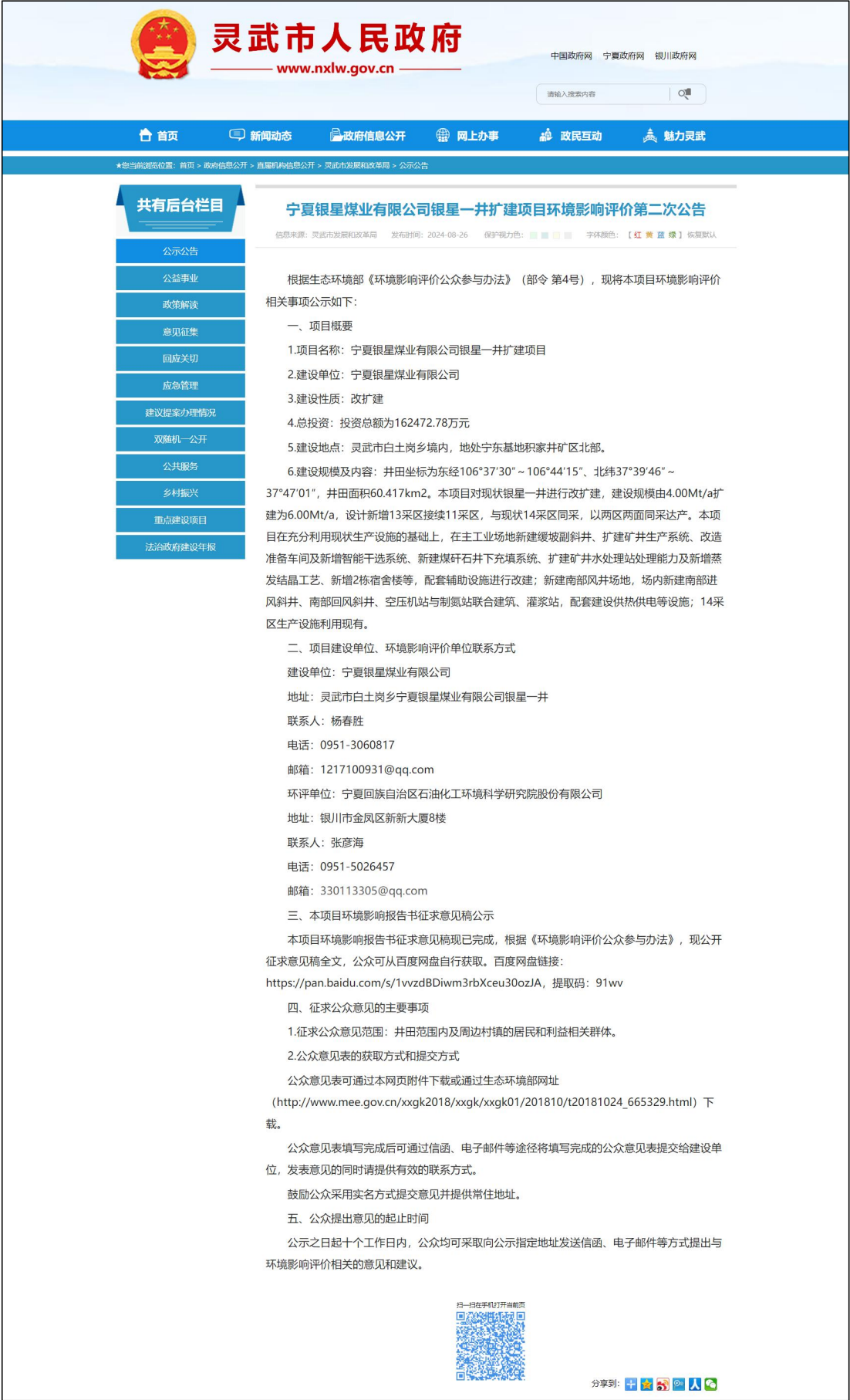
图2 本项目环境影响报告书征求意见稿公众参与信息网络公示截图