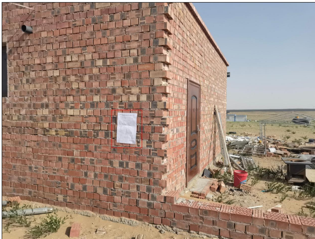
图 9 公众参与信息现场张贴公告图 (半个滩村民房屋)