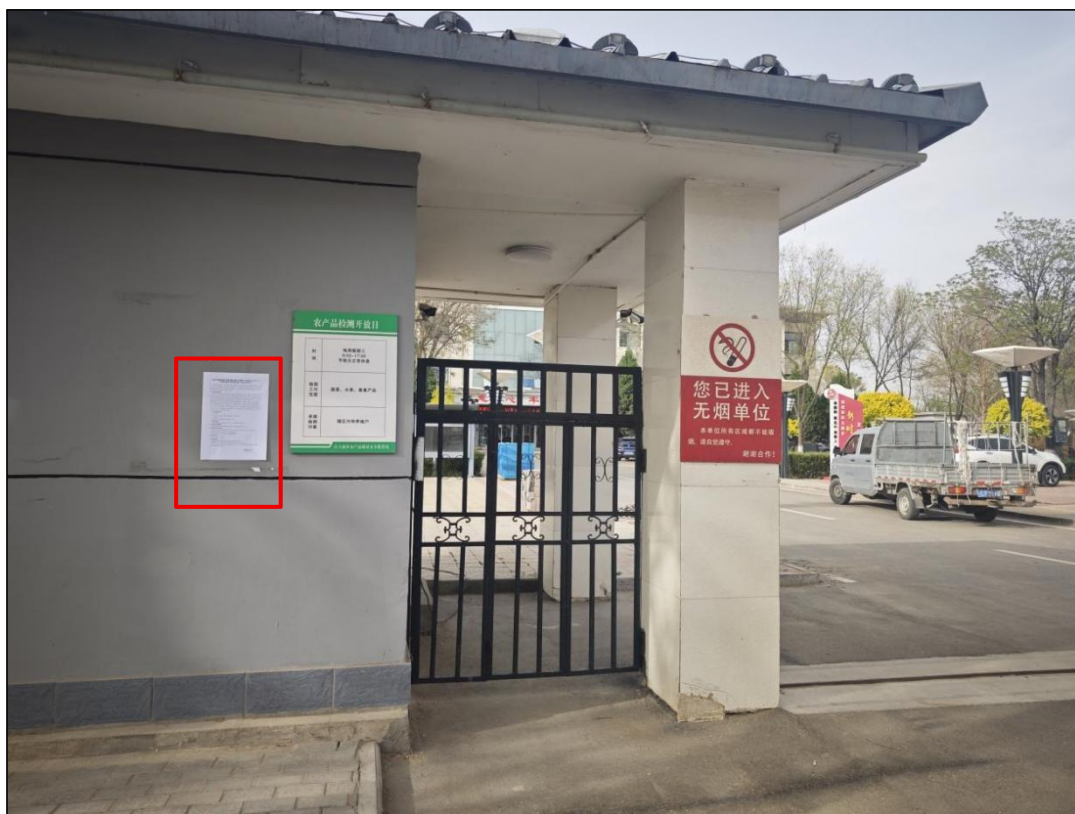
图 15 公众参与信息现场张贴公告图 (白土岗乡人民政府大门处)