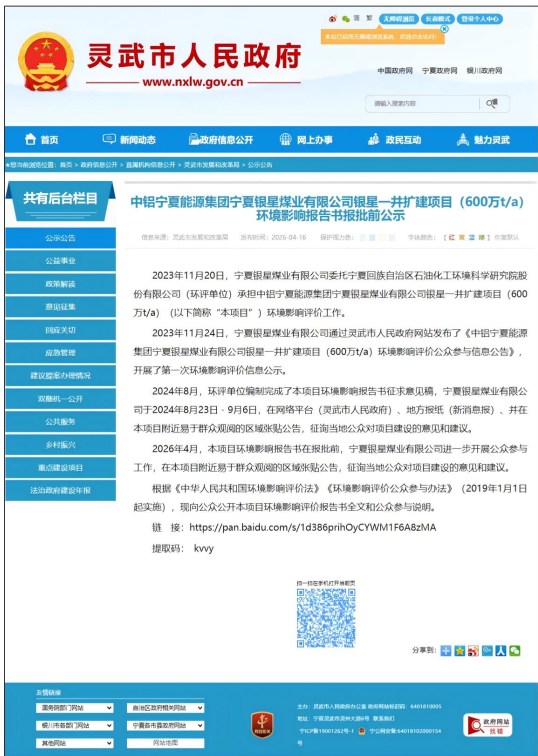
图 14 第二次报批前公众参与信息网络公示截图