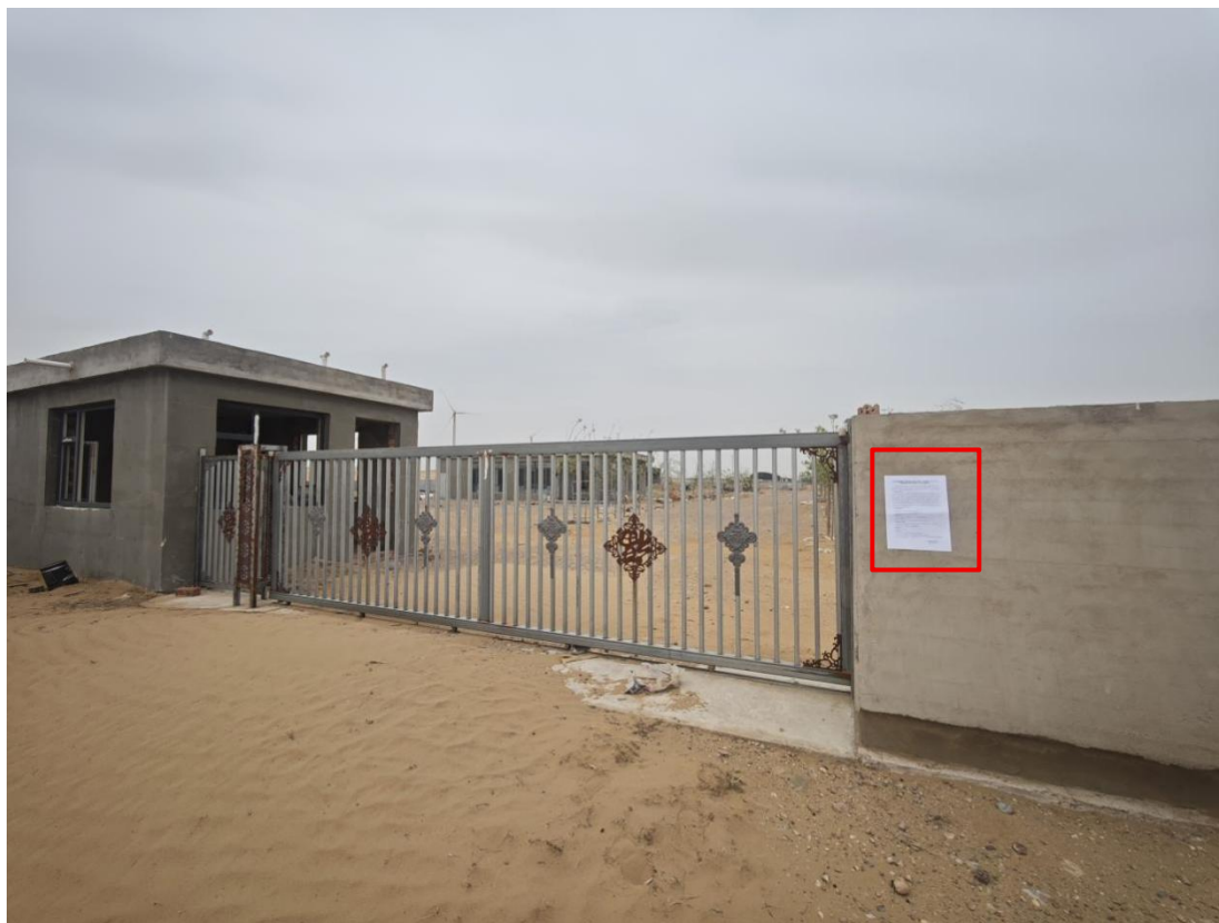
图 23 公众参与信息现场张贴公告图 (宁夏银盛农牧有限公司—养殖企业 4)