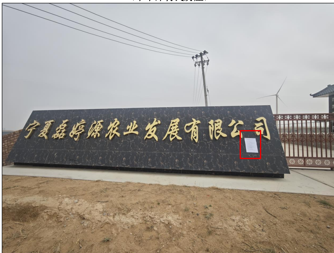
图 20 公众参与信息现场张贴公告图 (宁夏磊婷源农业发展有限公司—养殖企业 1)