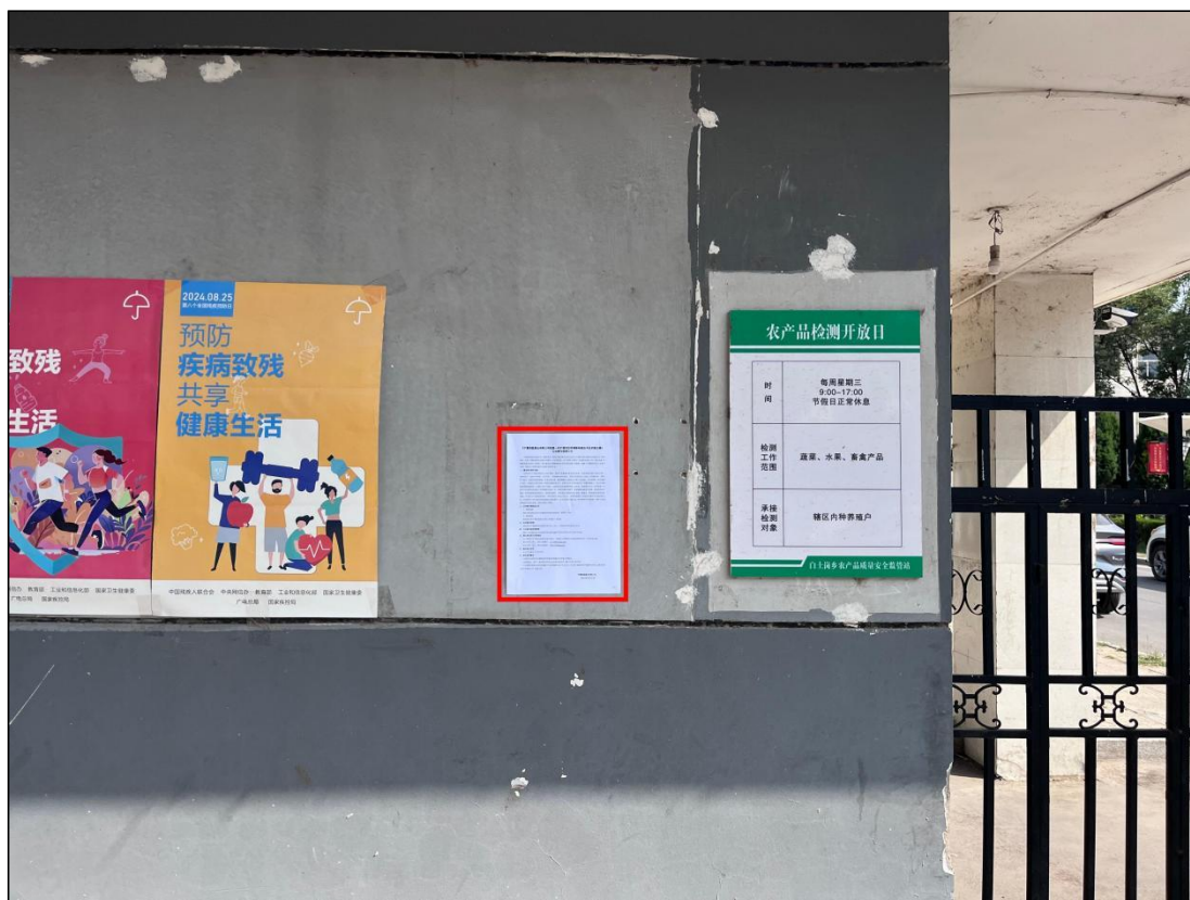
图 5 公众参与信息现场张贴公告图 (白土岗乡人民政府大门处)