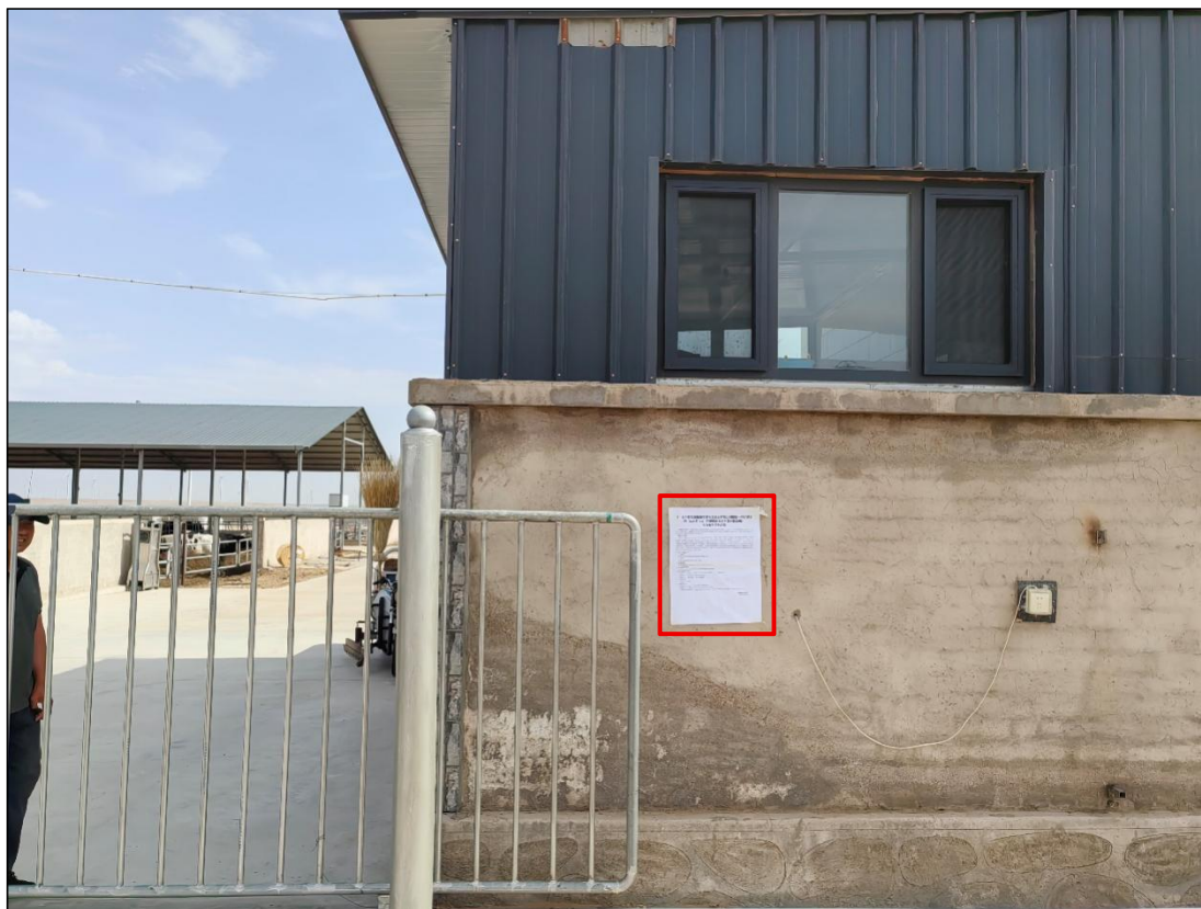
图 12 公众参与信息现场张贴公告图 (宁夏润涛农牧科技有限公司—养殖企业 3)