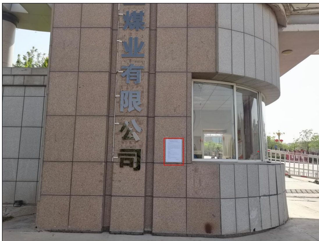
图 6 公众参与信息现场张贴公告图 (宁夏银星煤业有限公司大门处)