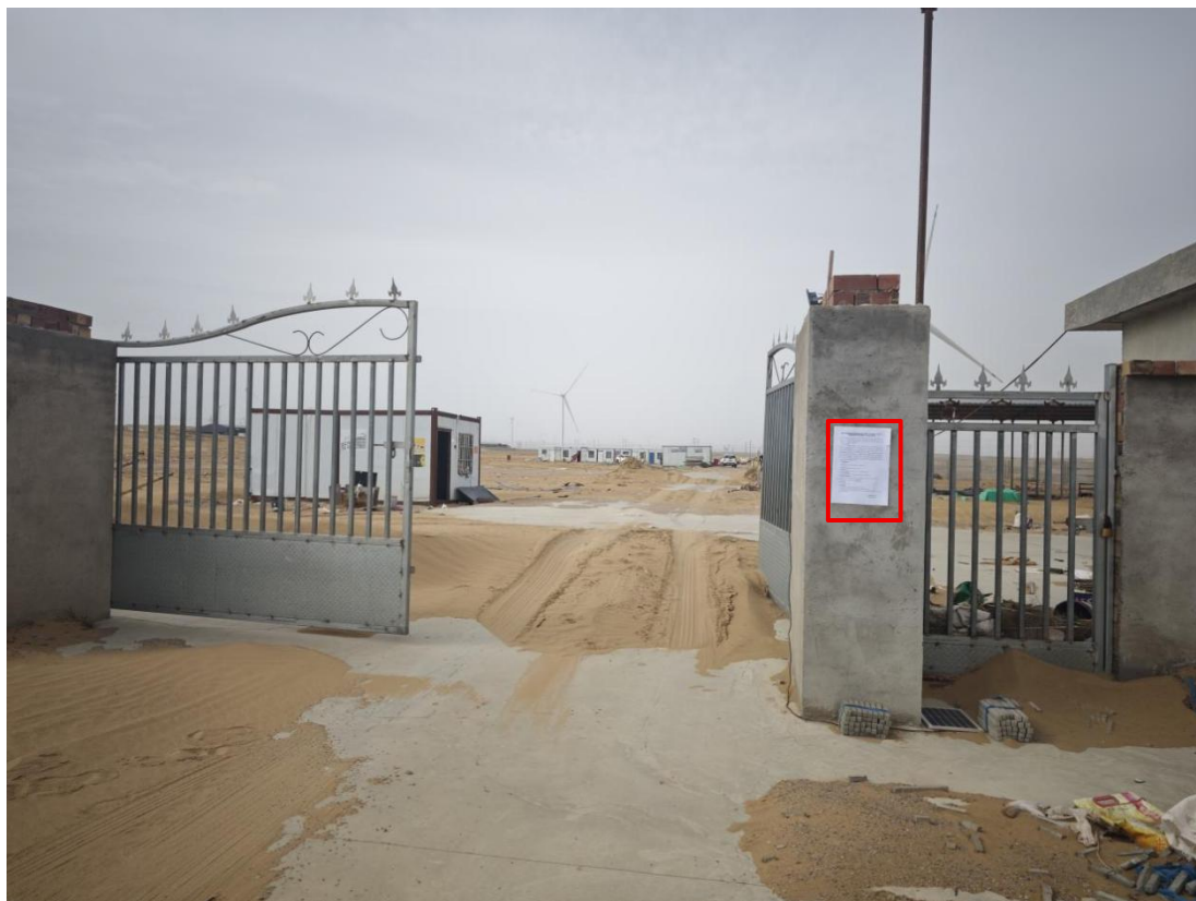
图 21 公众参与信息现场张贴公告图 (宁夏梦杰鑫瑞农林牧发展有限公司—养殖企业 2)