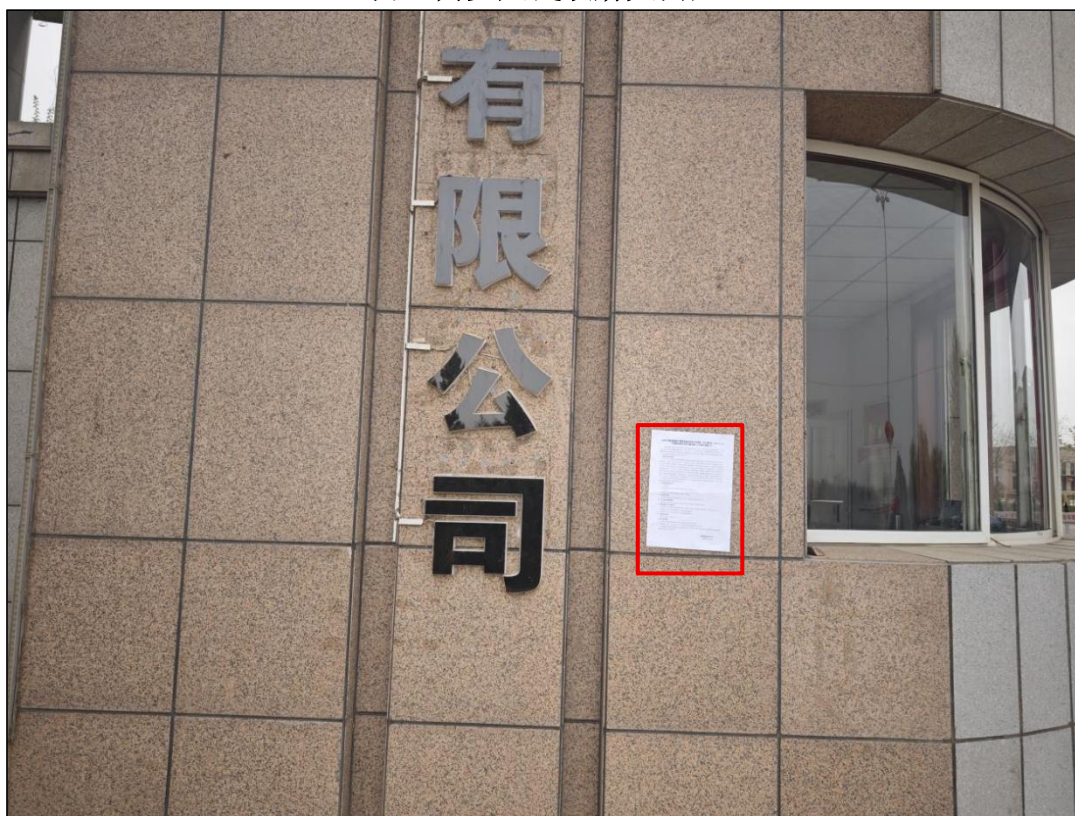
图 16 公众参与信息现场张贴公告图 (宁夏银星煤业有限公司大门处)