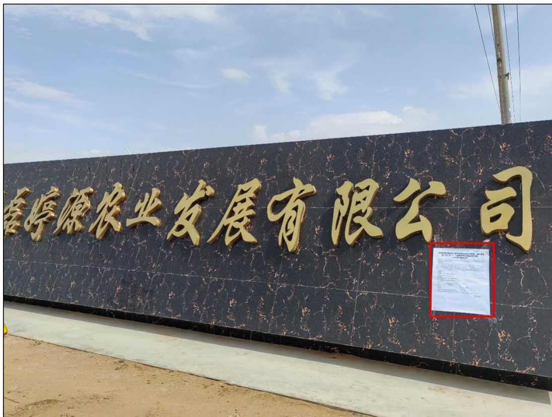
图 10 公众参与信息现场张贴公告图 (宁夏磊婷源农业发展有限公司—养殖企业 1)