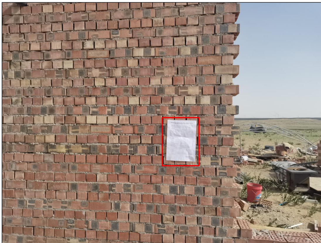
图 19 公众参与信息现场张贴公告图 (半个滩村民房屋)