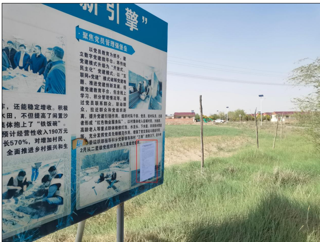
图 8 公众参与信息现场张贴公告图 (野麦子塘村南侧乡村振兴宣传栏)