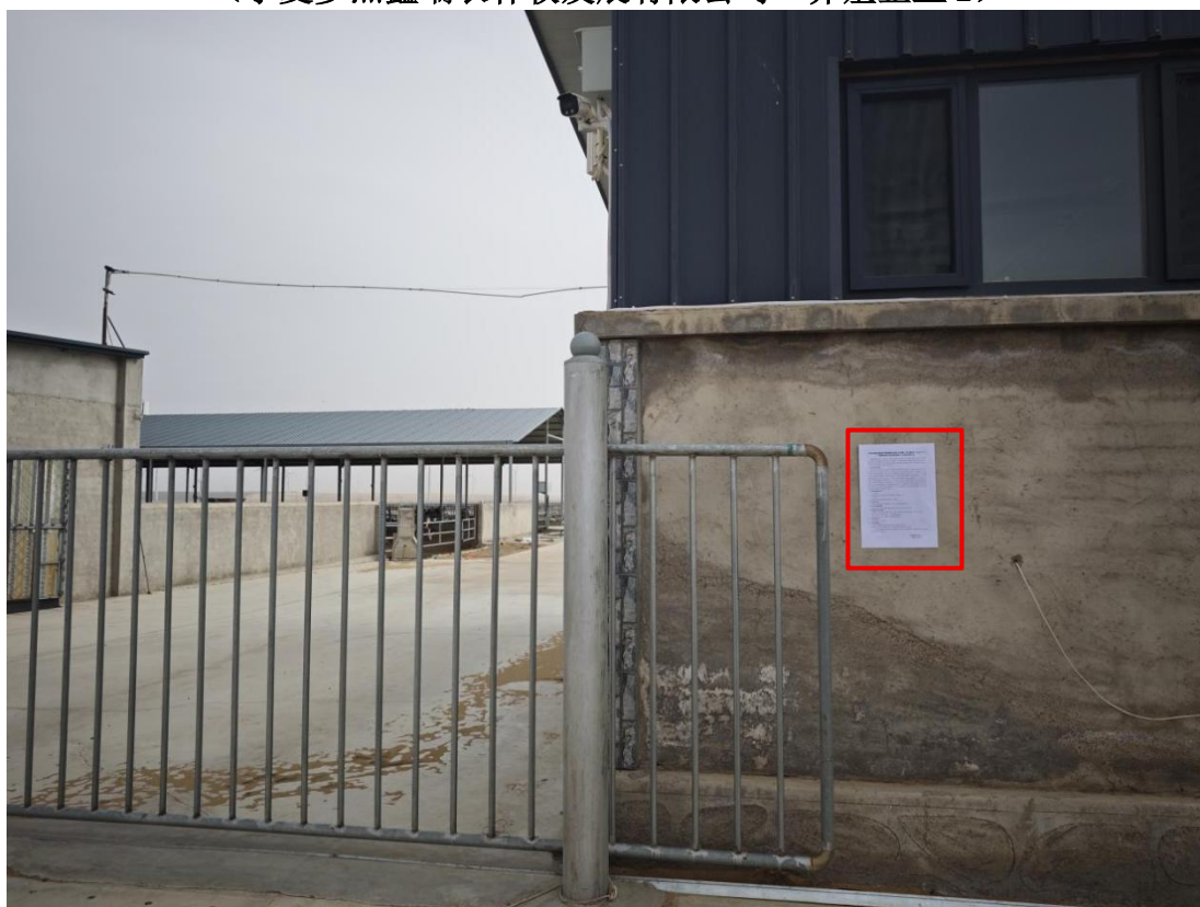
图 22 公众参与信息现场张贴公告图 (宁夏润涛农牧科技有限公司—养殖企业 3)