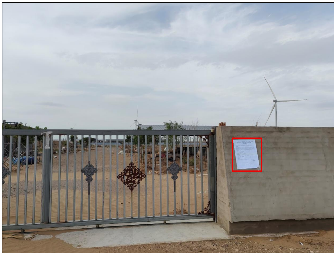
图 13 公众参与信息现场张贴公告图 (宁夏银盛农牧有限公司—养殖企业 4)