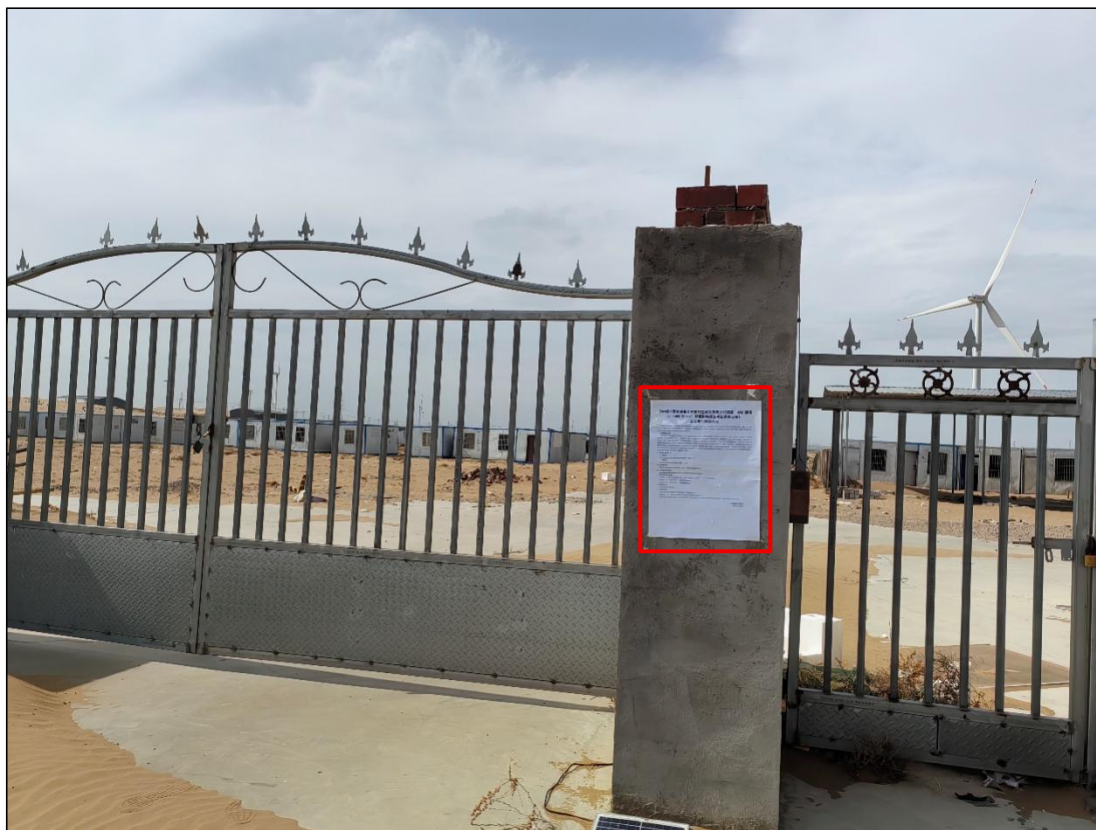
图 11 公众参与信息现场张贴公告图 (宁夏梦杰鑫瑞农林牧发展有限公司—养殖企业 2)