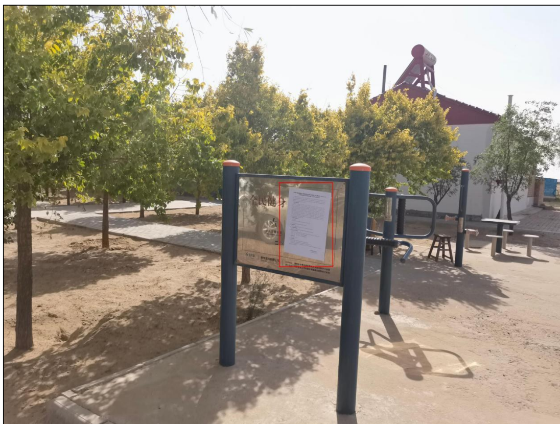
图 7 公众参与信息现场张贴公告图 (野麦子塘村村民健身区)