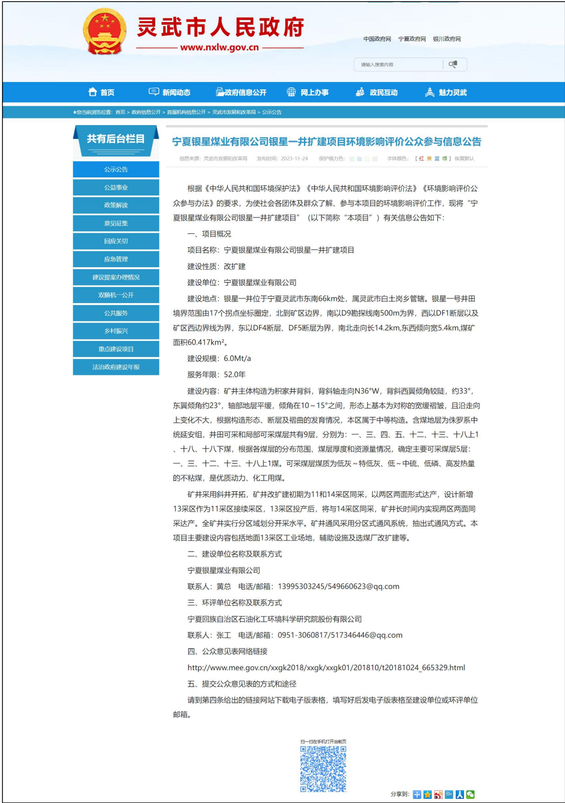
图 1 首次环境影响评价公众参与信息公示截图