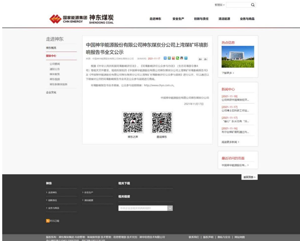
图 6 项目网站公告情况（神东煤炭集团网站）