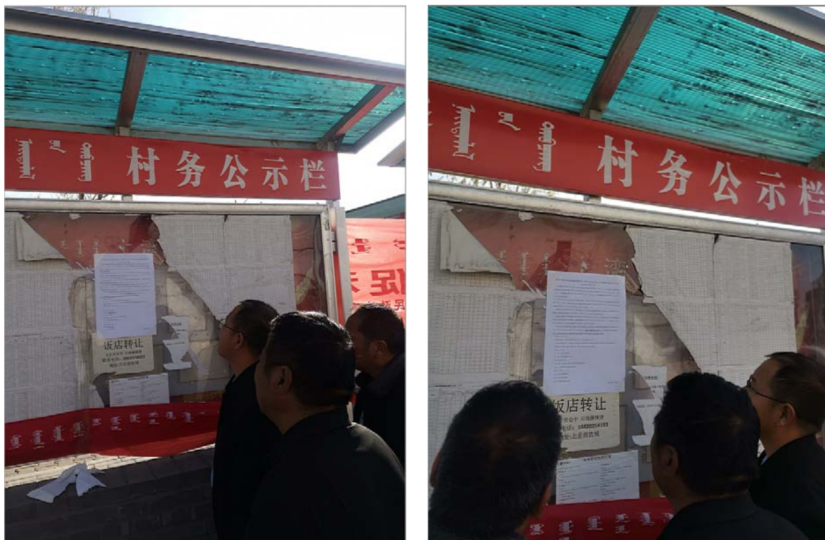
图 5 张贴公告情况（2020 年 11 月 6 日）