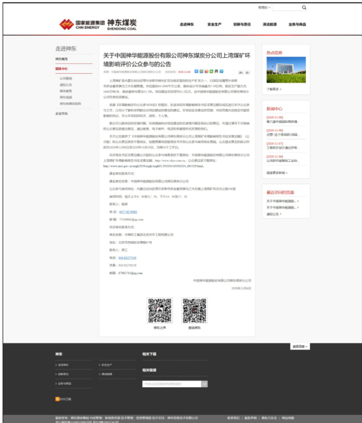
图 2 项目网站公告情况

环评报告书征求意见稿公示版和公众参与调查表的下载网址：中国神华能源股份有限公司神东煤炭分公司上湾煤矿环境影响报告书征求意见稿： http://www.chye.com.cn ， 公 众 意 见 表 下 载 网 址： http://www.mee.gov.cn/xxgk2018/xxgk/xxgk01/201810/t20181024_665329.html 。 网络公示截图见图 2。