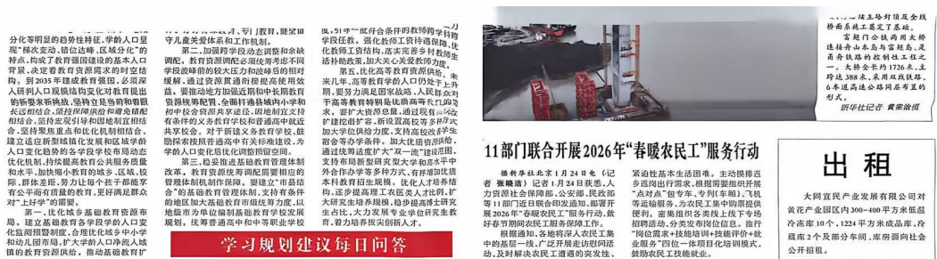
图3 2026年1月26日报纸公示