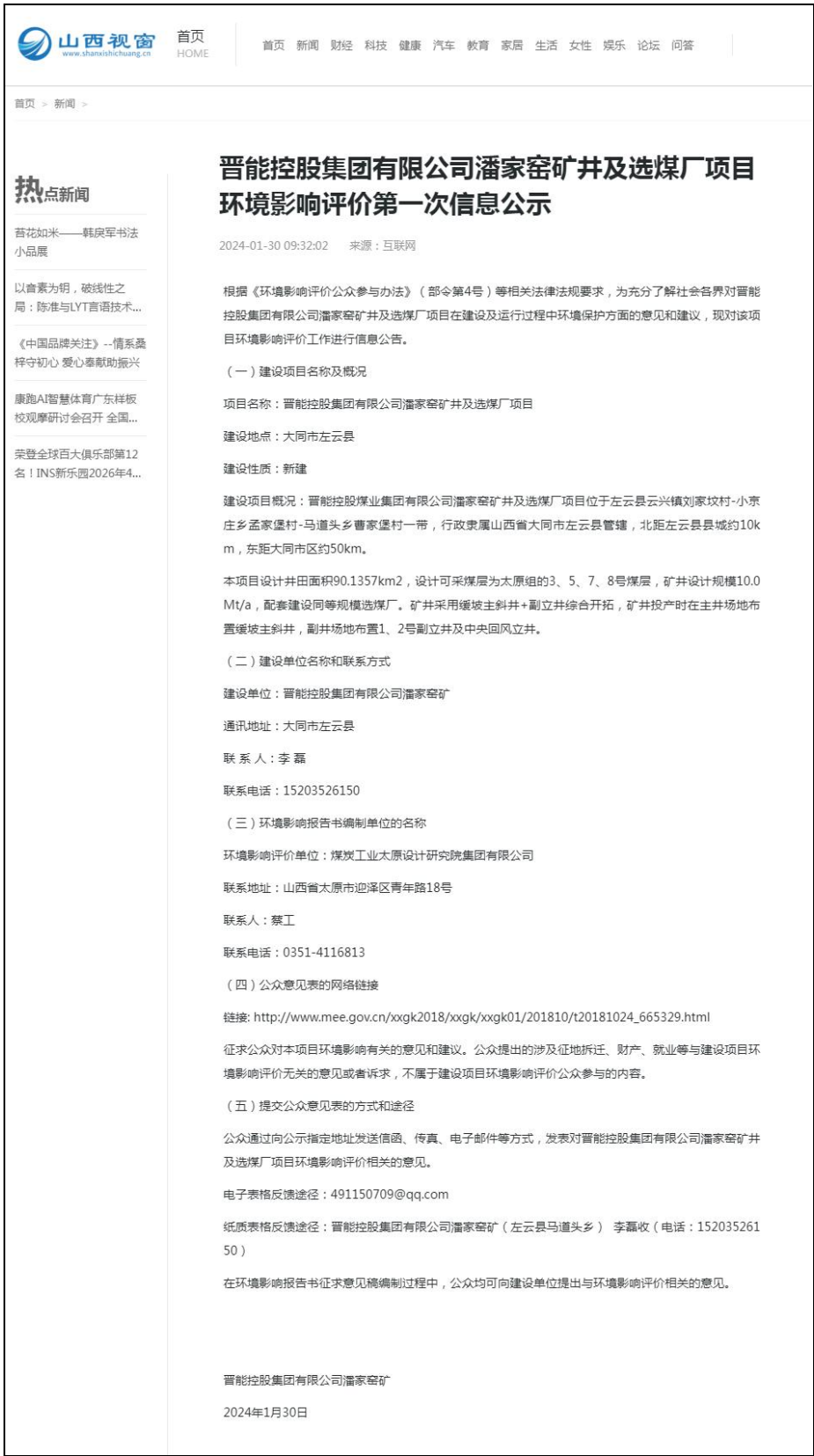
图 1 第一次网络公示截图