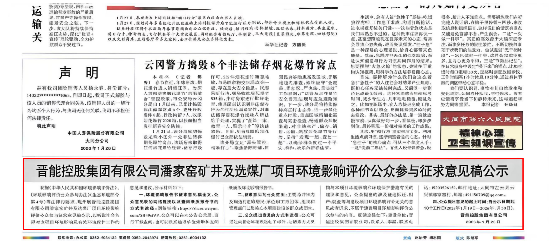
图 4 2026 年 1 月 28 日报纸公示

我单位在项目建设可能受影响的村镇张贴了项目公告，公告张贴地符合《环境影响评价公众参与办法》对公告张贴区域要满足易于项目所在地公众接触的要求。