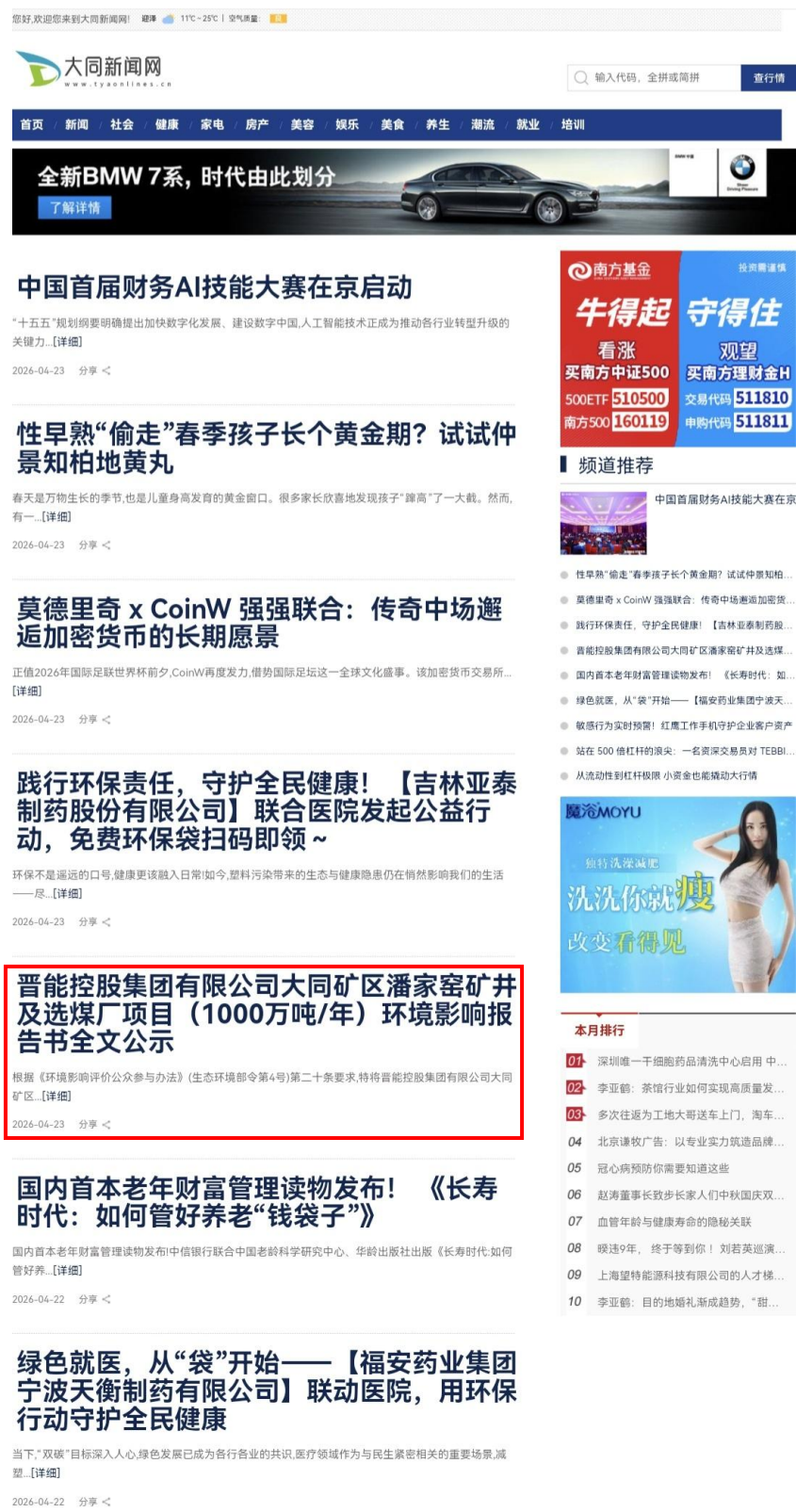
图 5 拟报批前公开情况截图